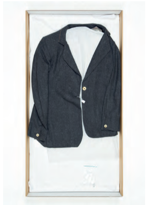
6a en b Archivering van een van de kostuums in een kostuumdoos.