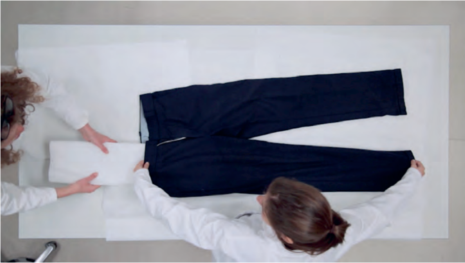
7 Aanbrengen van fiberfill omwikkeld met vloeipapier ter ondersteuning van de broekspijp.