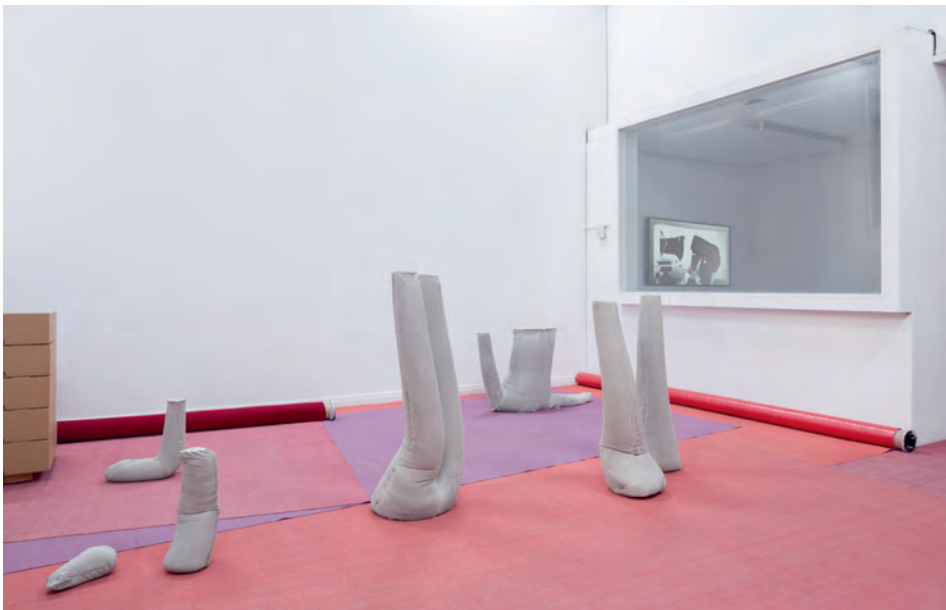
10 Presentatie RijksacademieOPEN 2016 , november 2016. Op de voorgrond de betonnen afgietsels, links de vijf archiefdozen met de kostuums en rechts de film van de archivering.