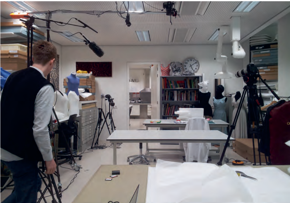
8 Filmopstelling in het textielatelier van de Universiteit van Amsterdam.