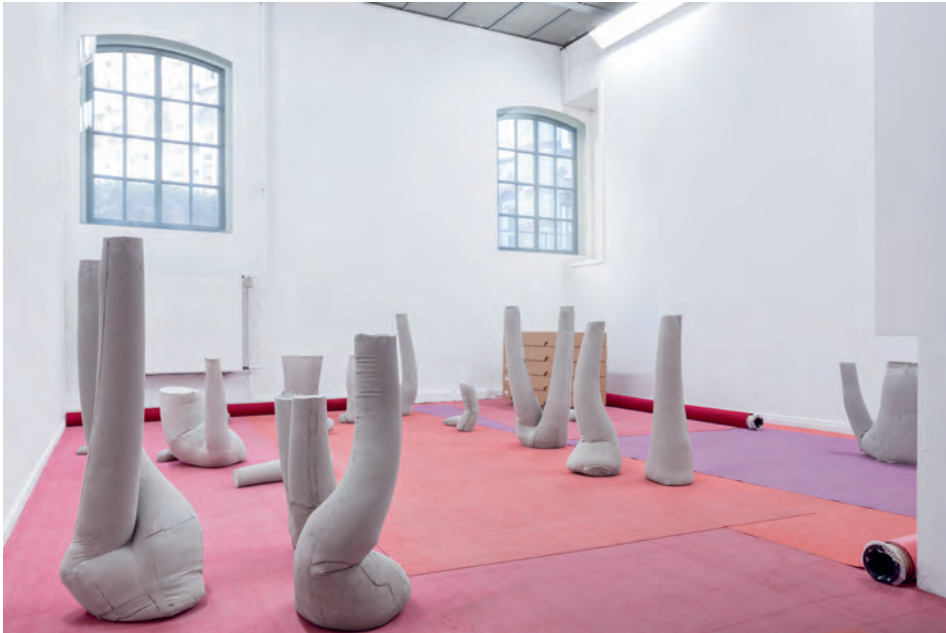
9 Presentatie RijksacademieOPEN 2016 , november 2016. Op de voorgrond de betonnen afgietsels, rechts achter de vijf archiefdozen met de kostuums.